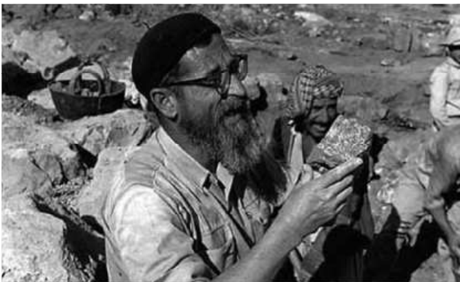
Isä Roland de Vaux (1903–1971) Qumranin kaivauksilla.