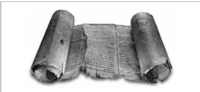
Ainoa kokonaisena säilynyt kirjakäärö, Jesajan kirja n. vuodelta 120 eKr.