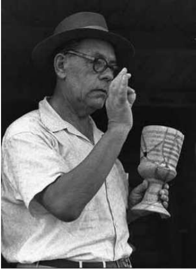
Professori Eleazar Sukenik (1889–1953).