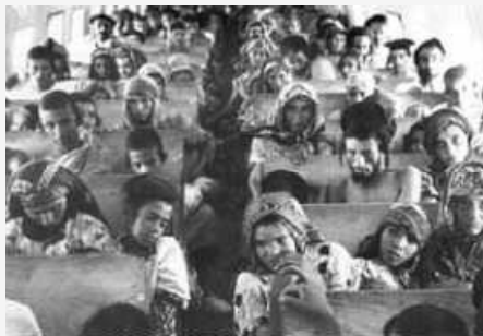
Operaatio "taikamatto".

Aluksi juutalaisilla oli vahva asema Himyarissa, joka oli yksi alueen kuningaskunnista. Monet sen asukkaat, jopa itse hallitsijaperhe, kääntyivät juutalaisuuteen, ja juutalaisuudesta tuli vallitseva uskonto. Tämä kesti vuoteen 525, jolloin Etiopian kristityt ottivat siellä vallan. Etiopian valta päättyi muslimivalloitukseen 600-luvulla, jolloin juutalaisista tuli "suojeltuja" toisen luokan kansalaisia. Heidän