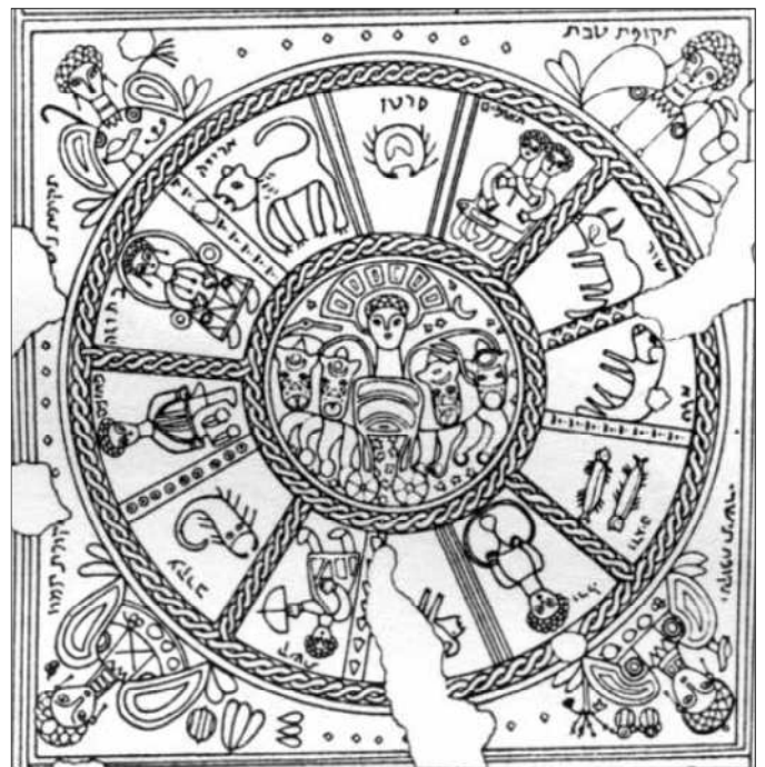
Beth Alphan eläinratamosaiikki.

Vuonna 1928 Hefzibah-kibbutsin maanviljelijät tekivät arkeologisia löytöjä. He kutsuivat paikalle arkeologeja Jerusalemissa, ja siitä lähtien on paikalla tehty kaivauksia moneen otteeseen. Arkeologit päättelivät, että paikalla oli muinainen synagoga. Nykyään sitä kutsutaan Beth Alphan synagogaksi. Löytynyt lattia on päällystetty mosaiikilla, jonka yksi kuvio kuvaa eläinrataa. Eläinradassa kaksosten merkki on talven lopussa Adar-kuun kohdalla.