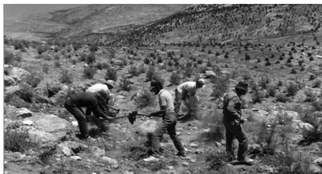
Keren Kajemet on menestyksellisesti taistellut aavikoitumista vastaan.

Israelilaiset tutkijat, jotka ovat seuranneet oliivipuiden vaikutusta Israelin autiomaiden ekosysteemiin, ovat havainneet, että oliivipuilla on kuivilla alueilla monia hyviä ympäristövaikutuksia. Sen lisäksi, että niistä saadaan oliiviöljyä, ne suojaavat villieläimiä, kuten muuttolintuja, jotka lentävät joka vuosi Israelin kautta. Ne puhdistavat ilmaa saasteista, kuten hiilidioksidista, toimivat jätteen sijoituspaikkana, kun jätteet on kompostoitu, ja ne auttavat pitämään loitolla haitallisia eläimiä kuten shakaaleja.