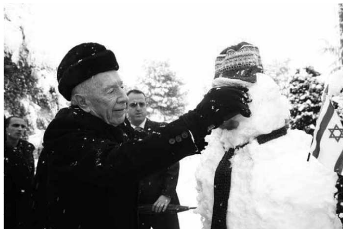
Presidentti Peres viimeistelee lumiukkoa.

Yli 700 puuta kaatui lumikuorman alla, jotkin lähiöt jäivät ilman sähköä. Raivaustyöt kestivät kauan. Tiepalvelu nosti ojasta kymmeniä ajoneuvoja, jotka olivat suistuneet tieltä.