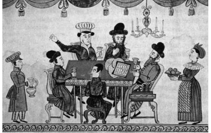
Ukrainan juutalaisia viettämässä pesahia 1800-luvulla.

Luetaan ääneen Haggada , liturginen teksti, joka kertoo Egyptistä lähdön yksityiskohtaisesti.