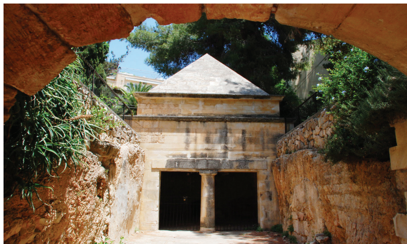
איור 4: קבר יסון ברחוב אלפסי ברחביה, חפירות רחמני מטעם אגף העתיקות, 1956

הפעילות הארכיאולוגית בשטח מדינת ישראל שבמערב העיר הייתה מצומצמת מאוד. רק תגלית אחת הנוגעת לימי הבית השני עלתה בחפירת הצלה של לוי יצחק רחמני, והיא קבר יסון בשכונת רחביה. 13 במזרח העיר כמעט לא נערכו חפירות הצלה ואי-אפשר להצביע על תגלית הנוגעת לענייננו.