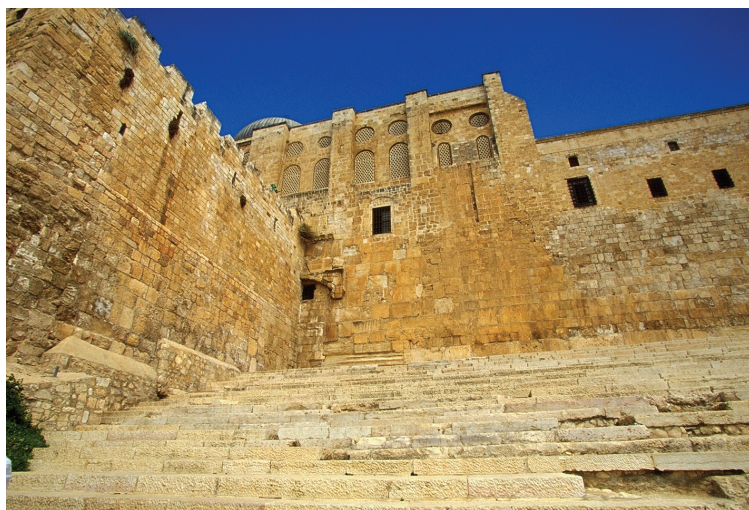
איור 5: מדרגות מונומנטליות העולות אל הר הבית מדרום, נחשפו בידי בנימין מזר בשנים 1968-1975

הממצאים שעלו בעבודתו של וורן על כותלי הר הבית ההרודיאניים. חלק מן השרידים כבר נתגלו בחפירתו של וורן, בהיקף המצומצם של פירי החפירה הצרים שלו. מזר הרחיבם מאוד וחשף קטעים גדולים יותר של המונומנטים ההרודיאניים. כך חשף קטע ניכר מן הבנייה ההרודיאנית המקורית של הכותל המערבי וקטע גדול עוד יותר של הכותל הדרומי. נחשפה גם האומנה שאחזה ב'קשת רובינסון'. מזר ואנשיו גם השכילו להראות כי מדובר בקשת שנשאה גרם מדרגות מונומנטלי (ולא גשר קשתות כפי שחשבו קודם לכן) שעלה מן הרחוב אל פינת הר הבית. נחשפו קטעים קטנים מן הרחוב המרוצף שנמשך לאורך הכותל המערבי של הר הבית. מונומנט שלא היה ידוע מחפירותיו של וורן היה גרם המדרגות המונומנטלי העולה אל שערי הדרומיים של הר הבית. מדרום להר הבית נחשפו גם קטעים של בתי מגורים ושל מקוואות טוהרה.