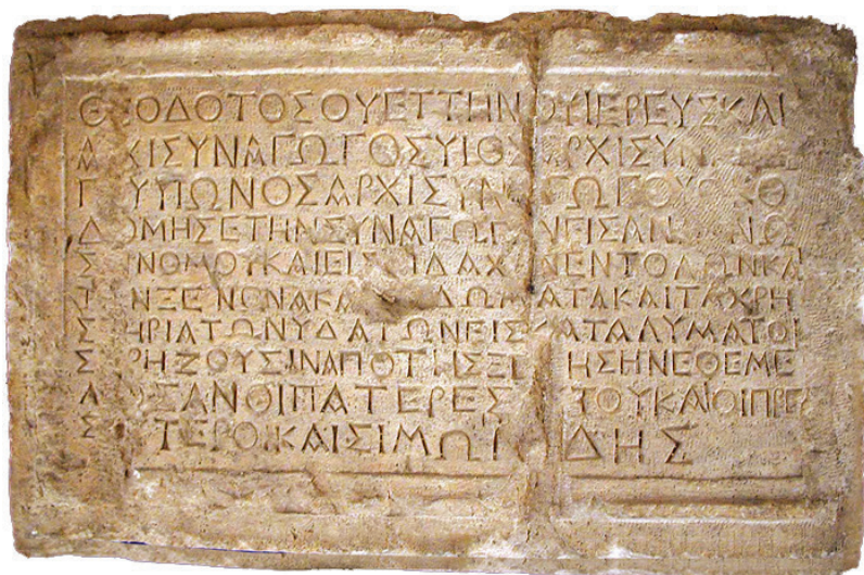
איור 3: כתובת תיאודוטוס, התגלתה בעיר דוד על ידי ריימון וייל בשנת 1913